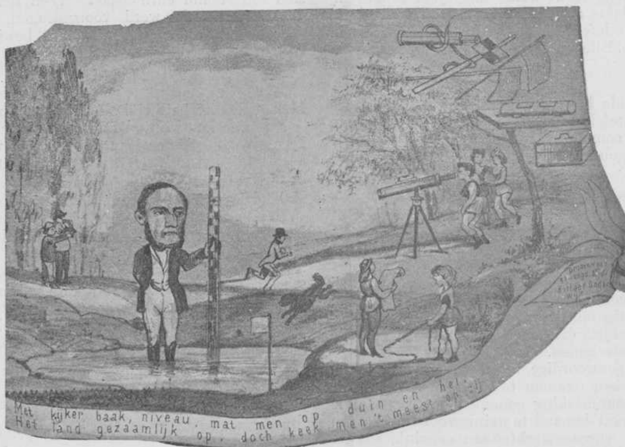
Met kijker baak, niveau, mat men op duin en het Het land gezaamd op, doch keek men 't meest op

opvattingen; er zijn echter ook zienswijzen, die den tand des tijds trotseeren. De Almanakplaat hieronder afgebeeld geeft er een onmiskenbaar bewijs van. Of voert ook nu niet de „bofpas” of „pas der professorengunst” veilig door het examengebergte, terwijl de gelukkige reiziger daarna in de „lethe of vloed der vergetelheid” de overtollige ken- nis weder op den bodem laat zinken?