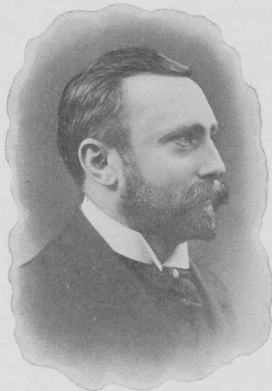
Eerste Rector Magnificus der Technische Hoogeschool.

maken. Bij de H. O. debatten in de Staten-Generaal van het vorig jaar, gaven meerdere leden als hunne opvatting te kennen, dat eene inrichting van H. O. tot kenmerkende eigenschap had, dat zij er was om de wetenschap te dienen