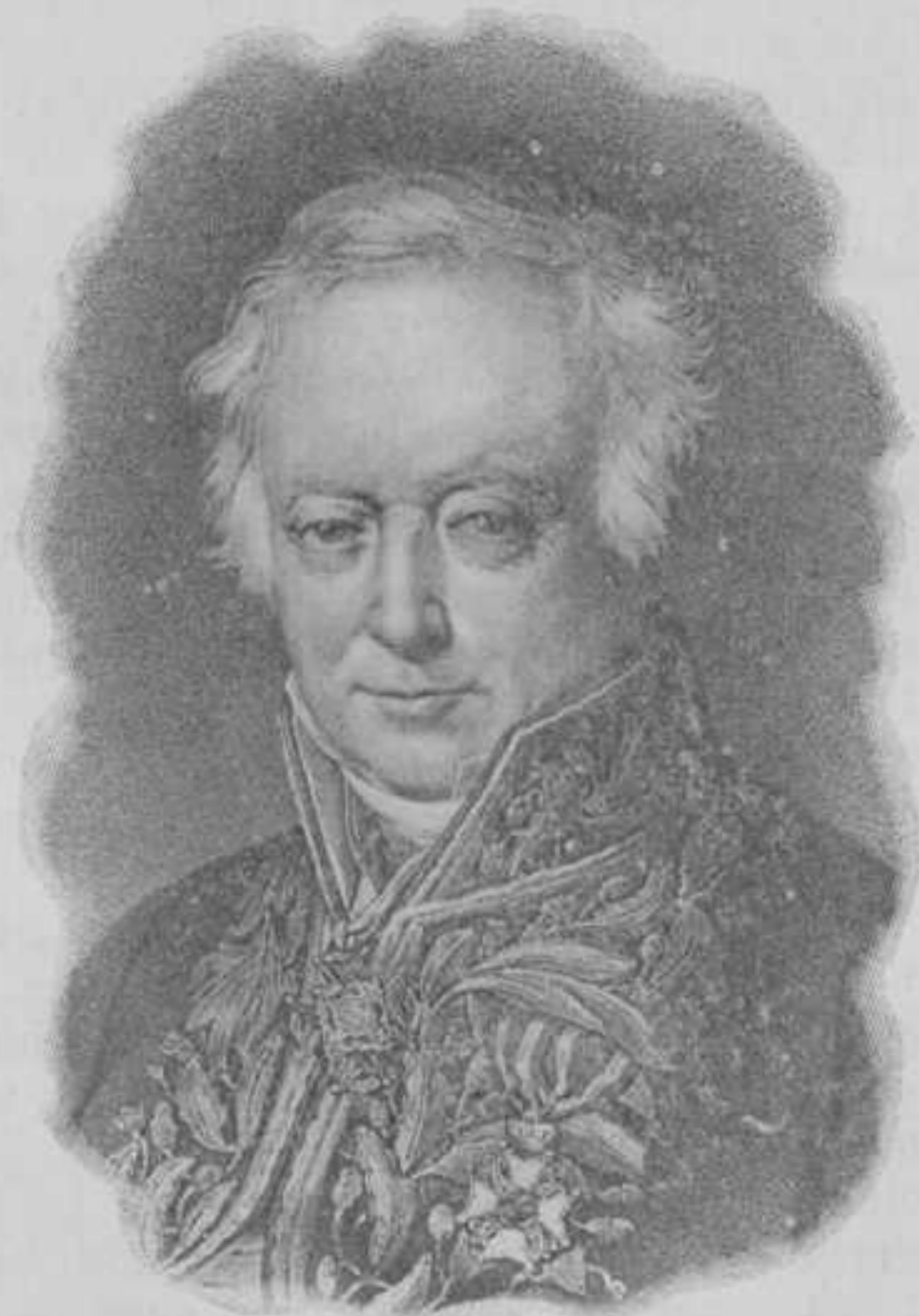
Eerste Directeur der Koninklijke Academie.

Nu dan de P. S. weer op 't punt staat plaats te maken voor eene Technische Hoogeschool, ligt het voor de hand den blik terug te richten op den tijd van hare wording, en waar zij nu zal verdwijnen, door niemand betreurd omdat de geleidelijke ontwikkeling wederom een grondige reorganisatie noodzakelijk maakte, daar heeft het een zekere bekoering zich eenigszins in te werken in het begin der zestiger jaren, toen de Koninklijke Academie hier onder zoo onrustige omstandigheden hare laatste levensjaren doormaakte. En het laat zich niet ontveinzen, dat het terugdenken aan die tijden voor een lid van het Delftsch Studentencorps iets buitengewoon aantrekkelijks en tevens nuttigs en leerzaams heeft, omdat men er onvermijdelijk door wordt teruggevoerd naar een groote periode van ons Corpsbestaan, waaruit voor alle verdere tijden lessen zijn te trekken, wier naleving den zekersten waarborg geeft voor eene schoone toekomst voor dat corps, waaraan wij zijn gehecht door het vele, wat wij er aan danken. Met rechtmatigen trots kunnen wij terugzien op wat toen door onze voorgangers is tot stand gebracht, want werkelijk niet gering is het aandeel, dat de toenmalige studenten hebben gehad in de opkomst van de Polytechnische School, die in 1864 in de plaats trad van hare voorgangster, de Koninklijke Academie. Groot was de verbetering daardoor verkregen.