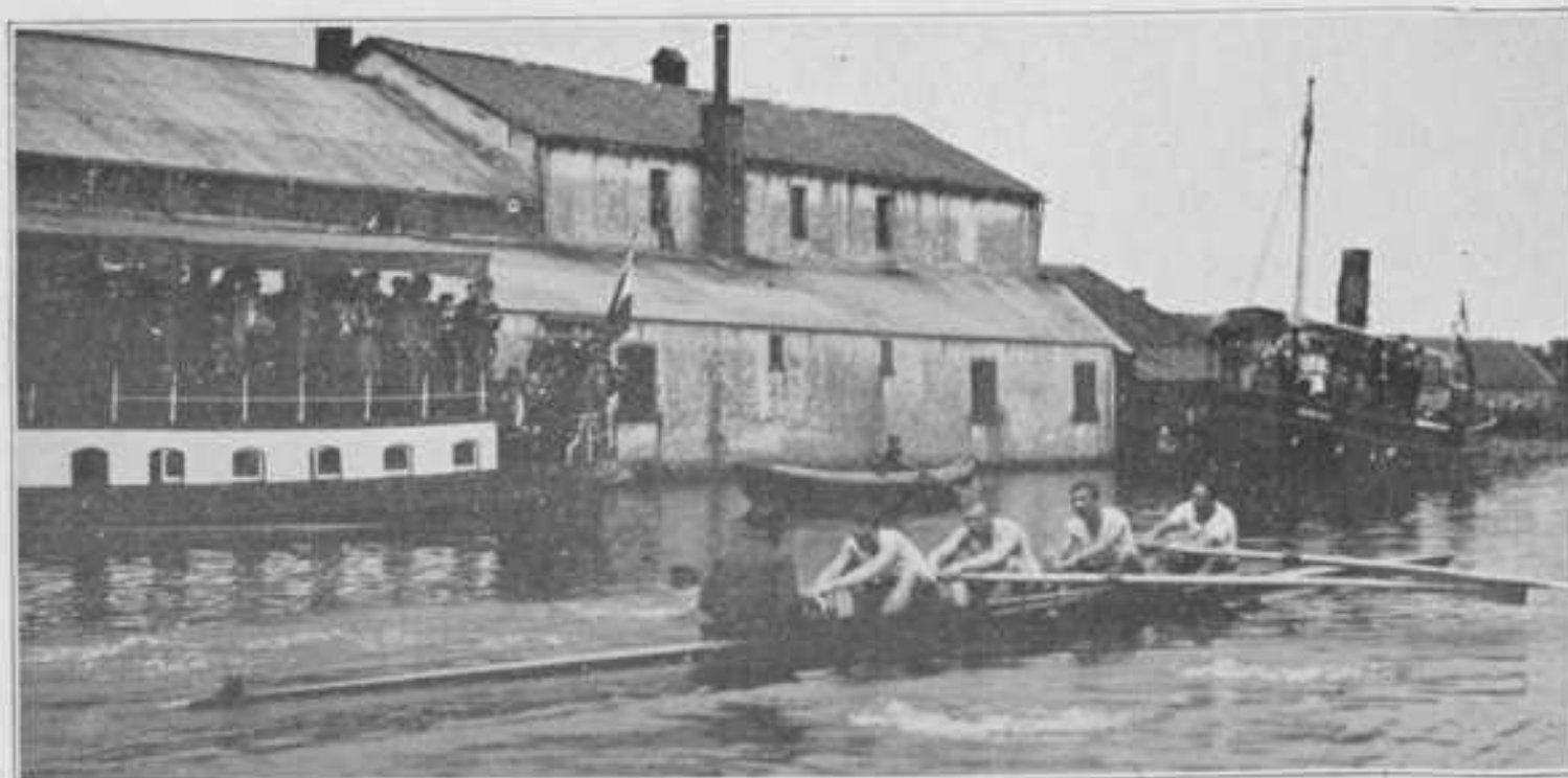
Winnende ploeg van Njord.

BIJLAGE behoorende tot het Studenten-Weekblad van Maandag 28 Mei '06, No. 29.