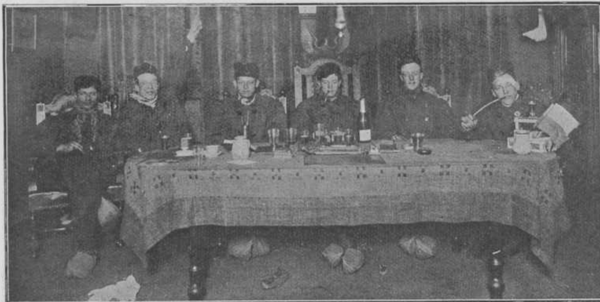
Bestuur der Societeit Phoenix.

Gecostumeerde Kroegjool op Maandag 3 Mei 1909.