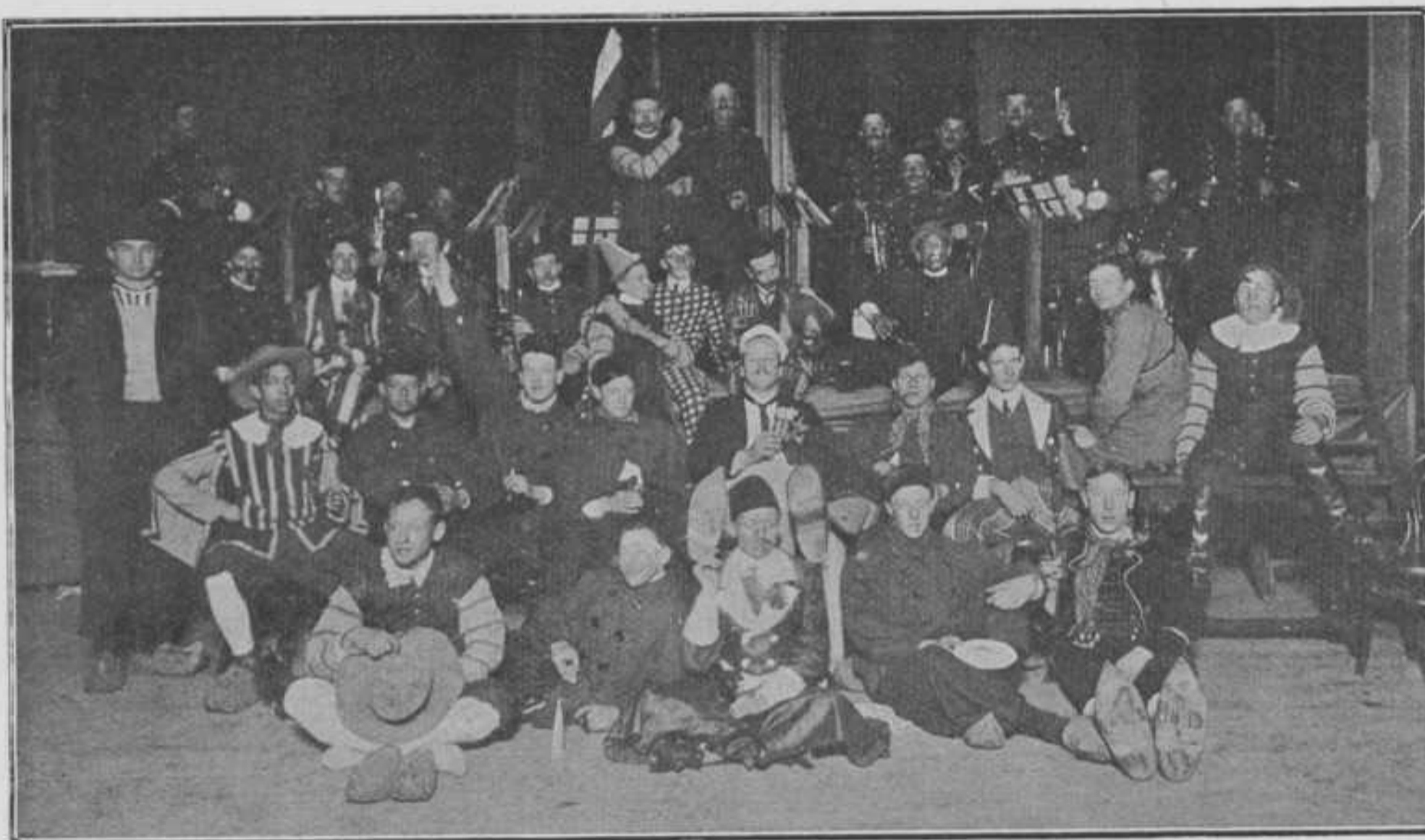
Groep der deelnemers.