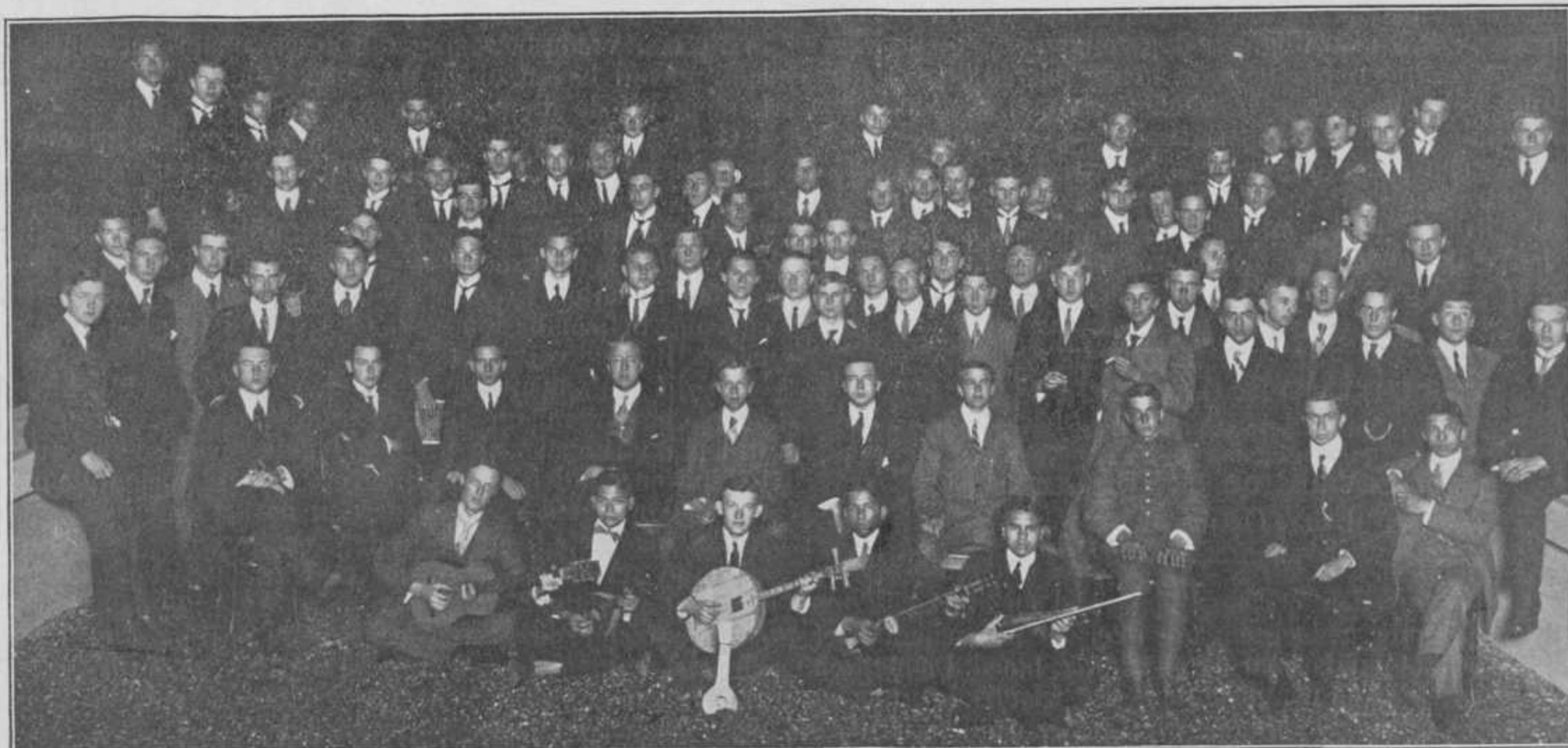
De Senaat van het D. S. C. met de Candidaat-Leden. (Kort voor het begin van den Groentijd).

Alle Corpsleden, die instaat zijn bij te dragen tot het welslagen van den Almanak voor 1915, worden daarom opgeroepen, ook onder de tegenwoordige omstandigheden te volbrengen, wat ze aan hun Corps verplicht zijn.