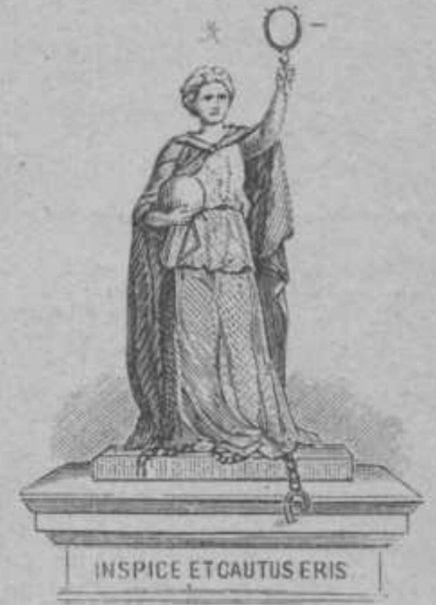
CORPSBEELD A°. 1864