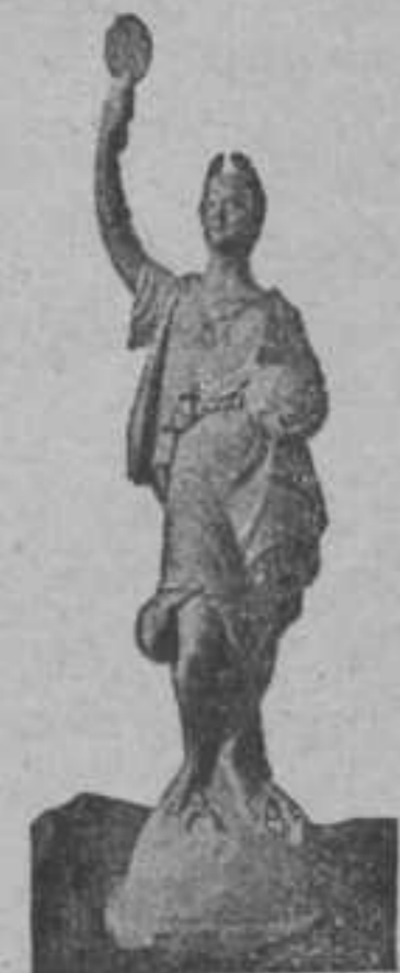
CORPSBEELD A°. 1898