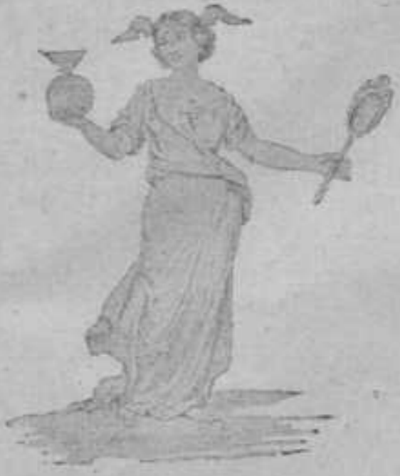
CORPSBEELD A°. 1857