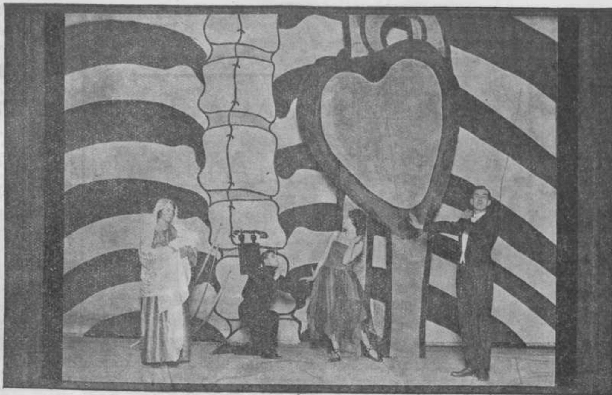
HET SCHOUWTOONEEL DER ZIEL