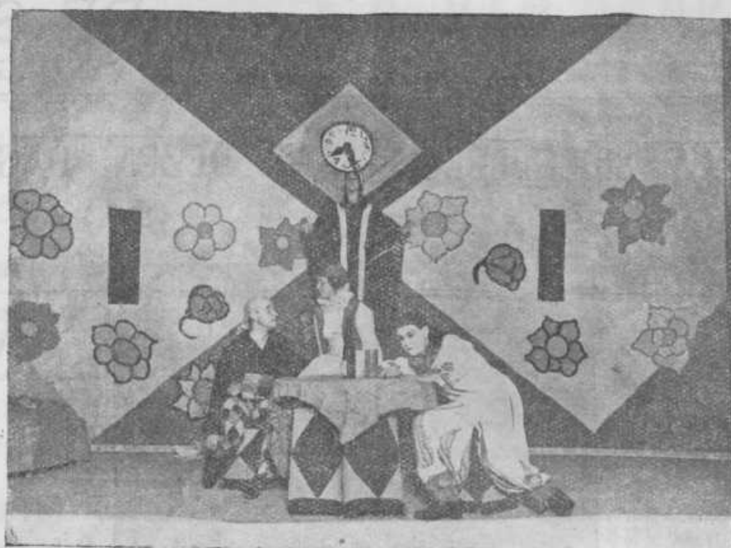
Uit oude Tijden: DE VROOLIJKE DOOD