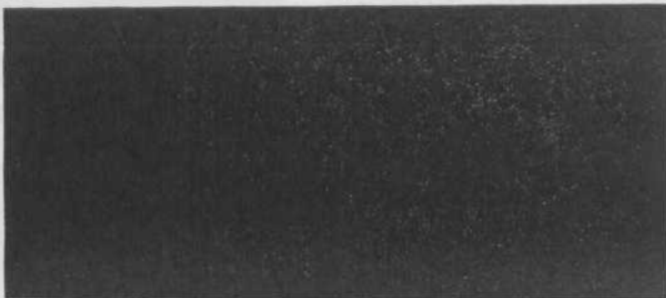
„De leden der D. S. A. F. V. aan het werk”.

Wij willen eindigen met het uitspreken van den wensch dat de bloei waar in „Vrije Studie” zich dit jaar wederom mocht verheugen zich zal bestendigen en dat het gezelschap als van ouds steeds pal zal staan voor „Vrije Studie” en tegen schoolschen dwang.