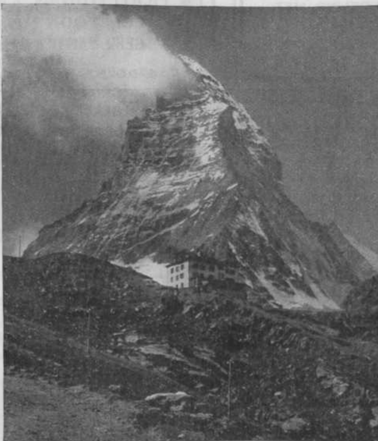
Matterhorn met Schwarzsee-hotel.

We bevonden ons nu ongeveer op dezelfde hoogte als „Riffel-