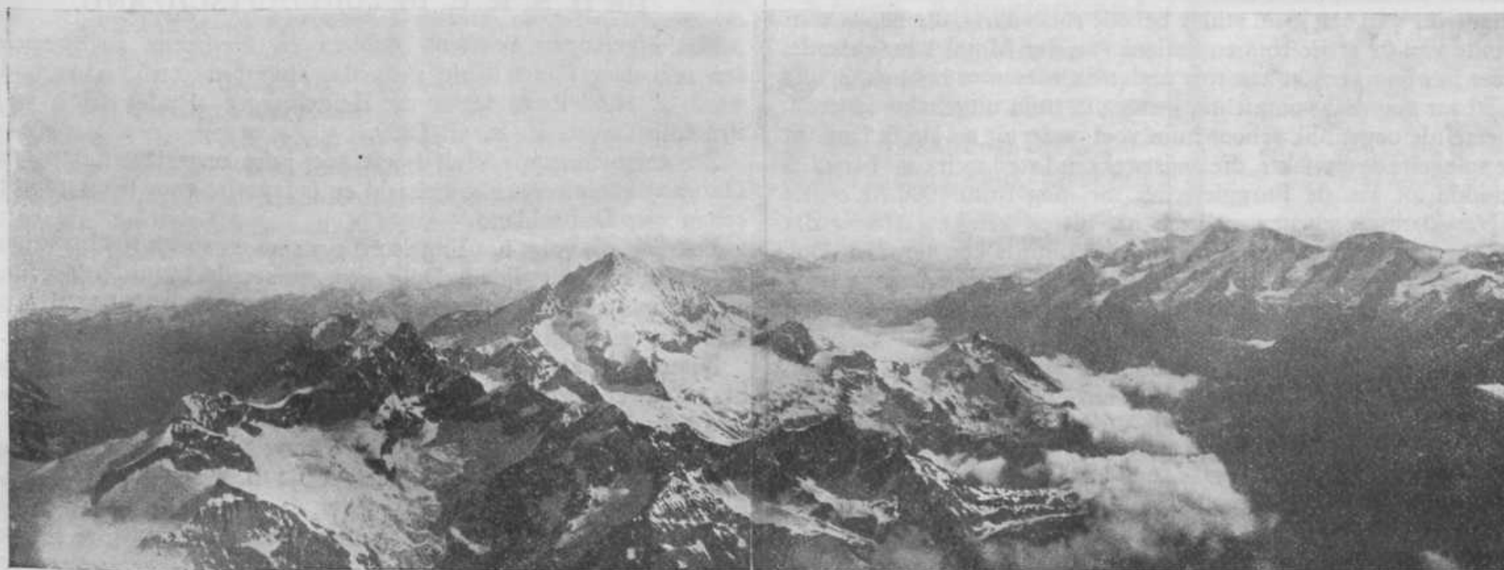
Panorama vanaf de Matterhorn.

Na een kwartier stapten we weer op en vervolgden onzen weg op den steeds steiler wordende graat, die evenwel nergens lastig bleek te zijn. Vlak voordat we bij den „Schulter" kwamen, moesten we een klein eindje over den kam van den graat zelve. Nauwlijks gluurden onze nieuwgierige gezichten over het randje in den wijde gapenden afgrond aan de Z'Mutt zijde of een ijzige wind woei ons stuifsnieuw in het gezicht. Op hetzelfde oogenblik dat we op het smalle randje stonden met knipperende oogen, zag ik dat Hans zijn