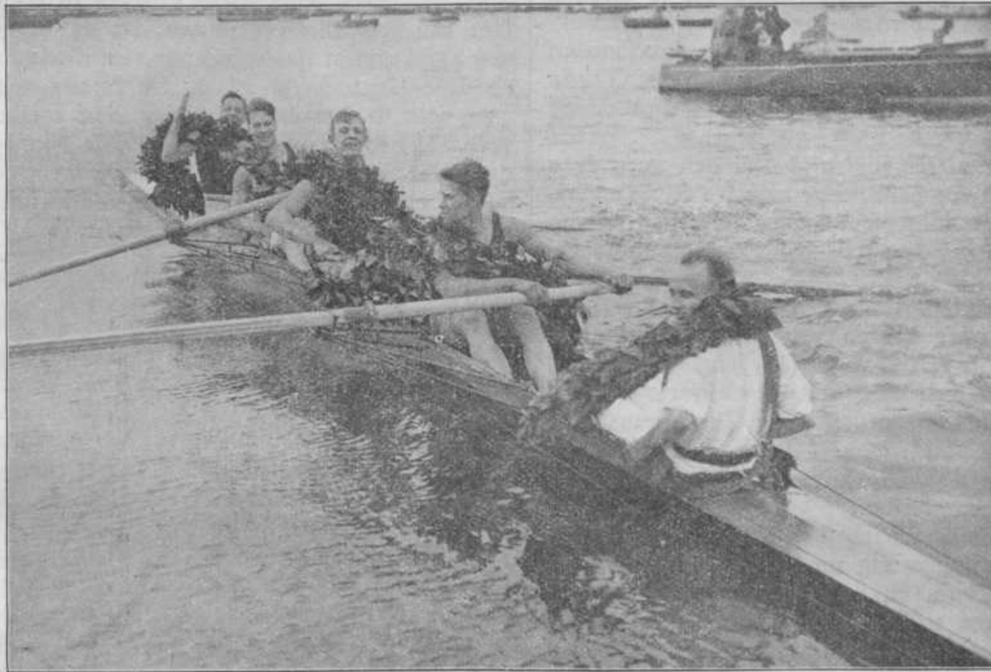
De Oude Vier.

Ongetwijfeld heeft het in ons allen bij het zien of het vernemen