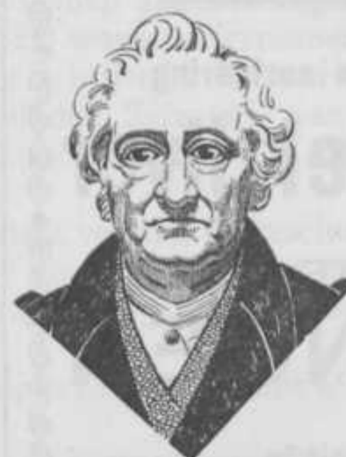
Johann Wolfgang von Goethe (1749-1832)

ONDERLINGE LEVENSVZERKERING VAN EIGEN HULP - KORTENAERKADE 3, DEN HAAG