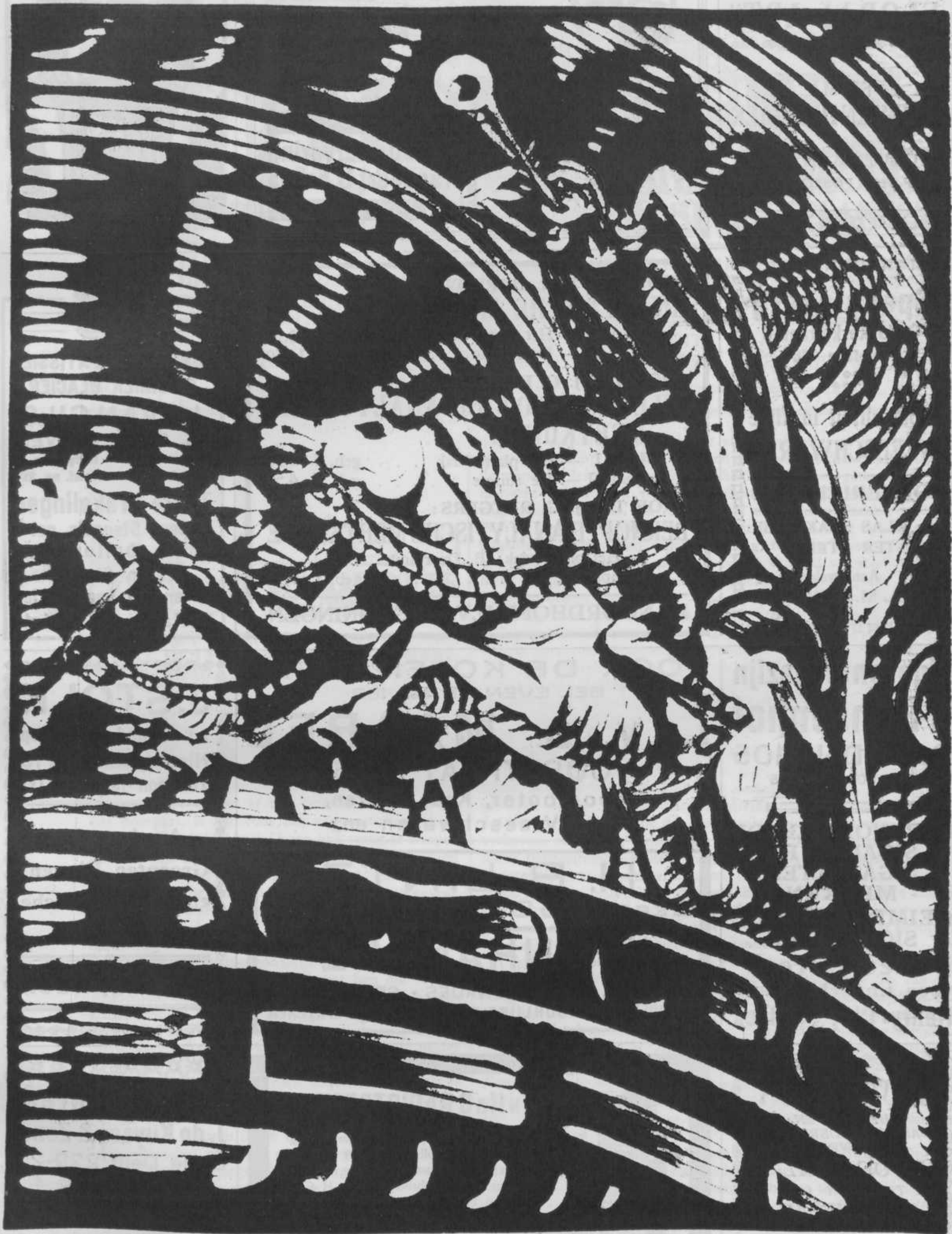
CAROUSSEL. 't Kostbaar kleinood. Gevers Deynoot: Wilde vaart, Houten paard! Vossestaart Sterk gebit. Eén cent de rit.