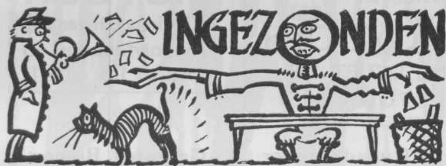
DELFT EN ANTHROPOSOPHIE.

Nu ieder Delftenaar een aankondiging ontvangen heeft van het feit, dat de Anthroposophische Vereeniging deze zomer op de Stakenberg een kamp gaat organiseeren, lijkt mij dit het oogenblik om de vraag: „wat heeft de Delftsche student met anthroposophie te maken?” te dezer plaatse eens wat nader te beschouwen.