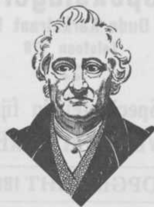
Johann Wolfgang von Goethe (1749—1832)

ONDERLINGE LEVENSVZERZEKERING VAN EIGEN HULP, KORTENAERKADE 1, DEN HAAG