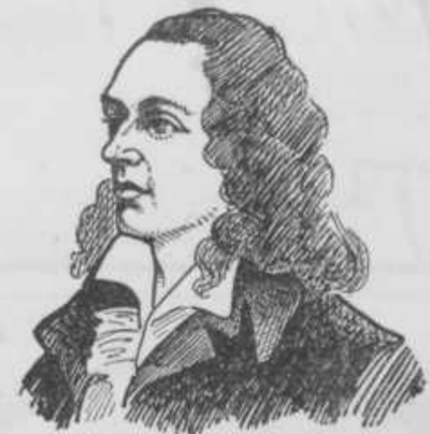
Friedrich von Schiller 1759—1805

ONDERLINGE LEVENSVZERKERING VAN EIGEN HULP, KORTENAERKADE 1, DEN HAAG