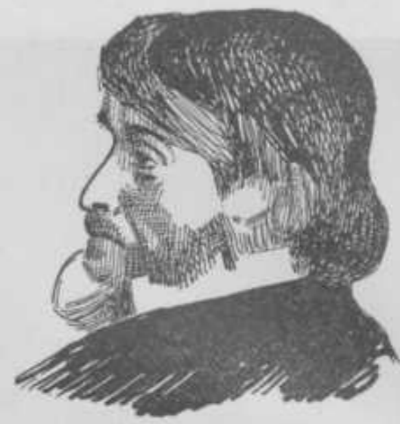
Thomas Carlyle 1795-1881.

De Engelsche denker wijst hier den weg voor elkeen. Wie niet studeert slaagt niet, wie geen orde op zijn zaken stelt komt in zorgen en nood