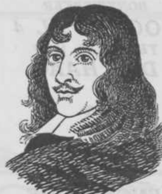
François VII, duc de La Rochefoucauld, (1613-1680) man van de wereld, denker en schrijver. Vooral bekend door zijn „Maximes“