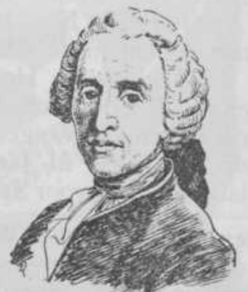
Christian, Fürchtegott Gellert deutsche dichter. (1715-1769)

van 1879 ONDERLINGE LEVENSVZERZEKERING VANEIGEN HULP KORTENAERKADE 3, DEN HAAG