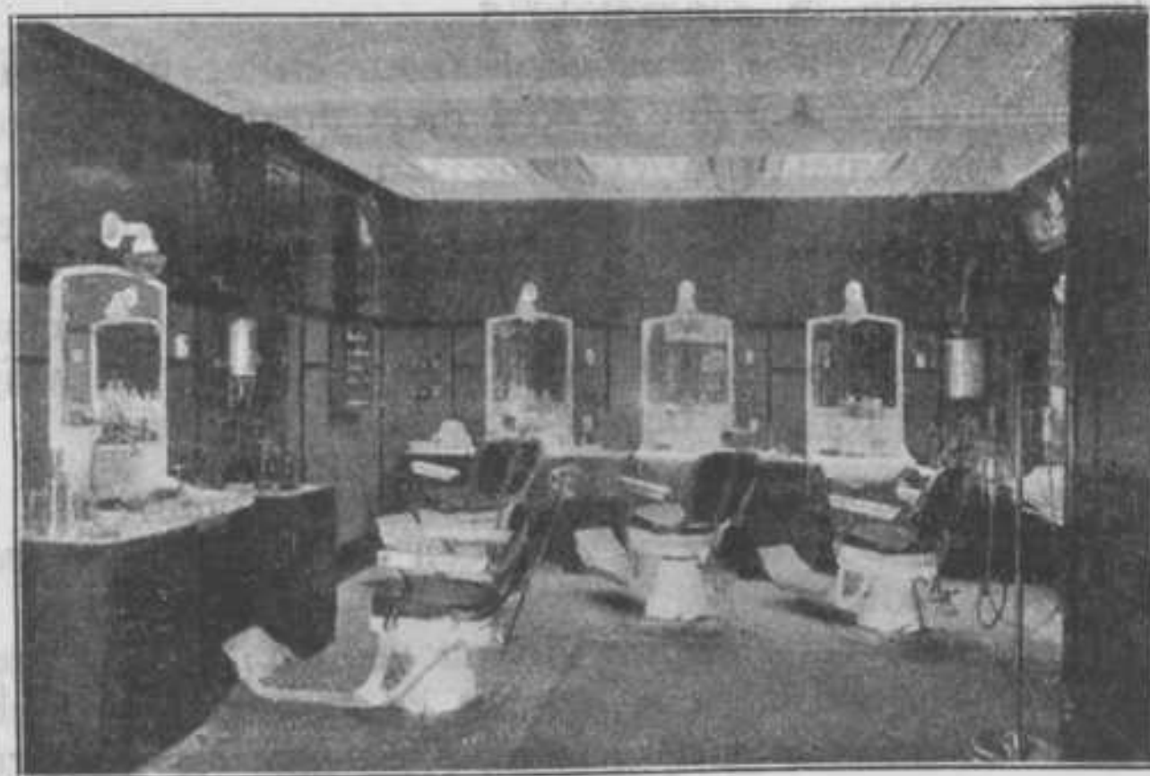
A. van der Brugge HEERENKAPPER BREESTRAT 30, DELFT