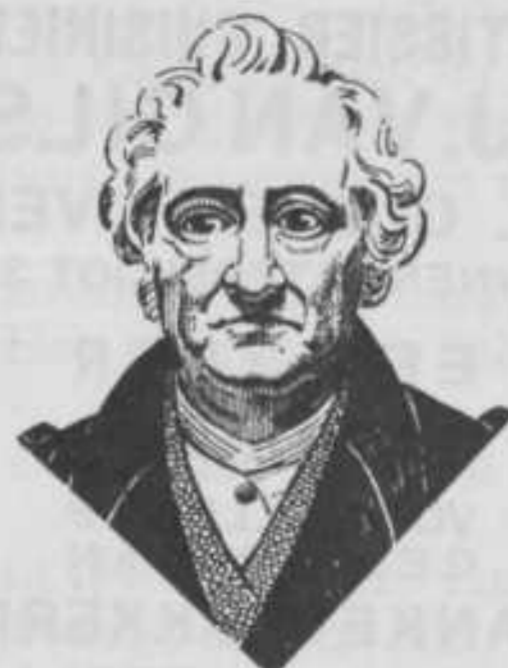
JOHANN WOLFGANG VON GOETHE (1759—1832)

ONDERLINGE LEVENSVERZEKERING VAN EIGEN HULP, KORTENAERKADE 3, 's-GRAVENHAGE