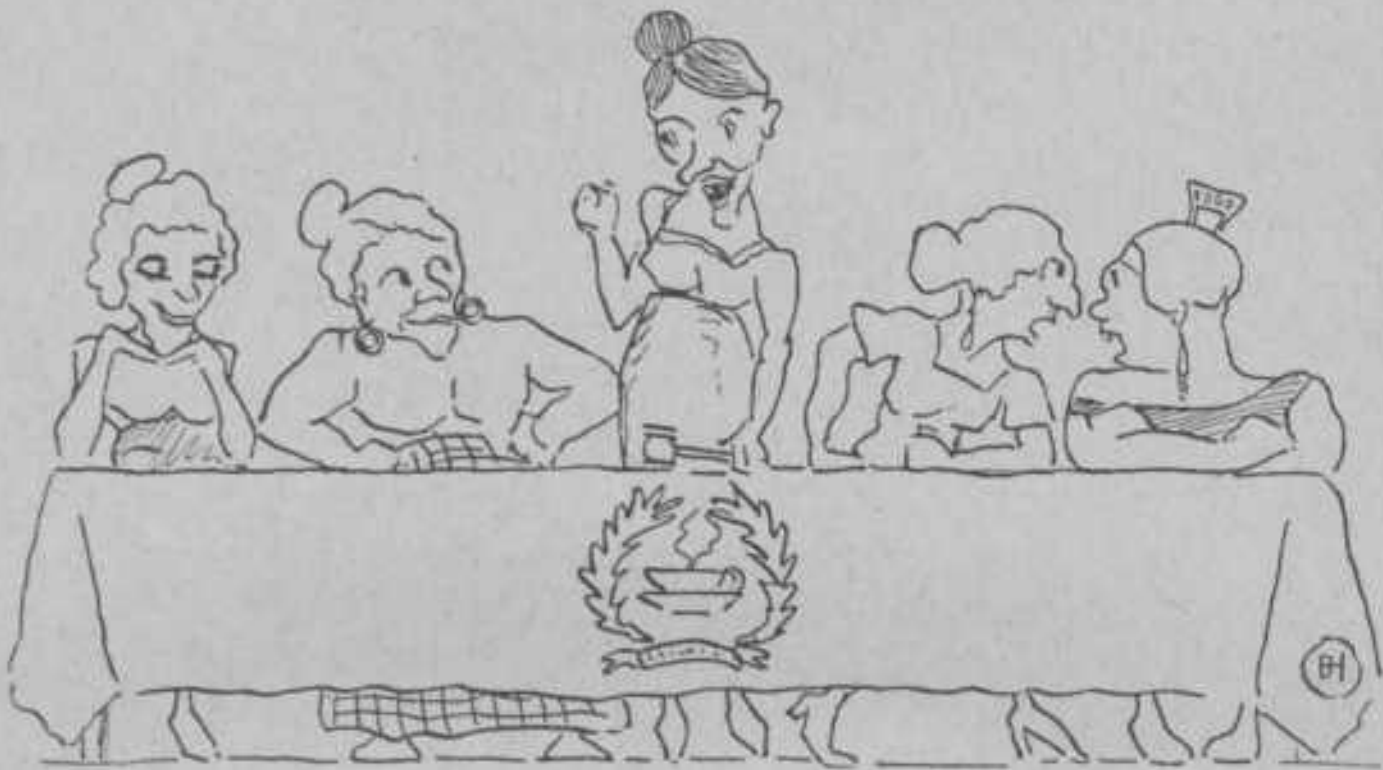
6e LUSTRUM D. V. S. V.

UITGAVE EN ADMINISTRATIE: NAAMLOOZE VENNOOTSCHAP W. D. MEINEMA - HIPPOLYTUSBUURT 6 13e JAARGANG VRIJDAG 30 OCTOBER 1936 10 BLZ. No. 7