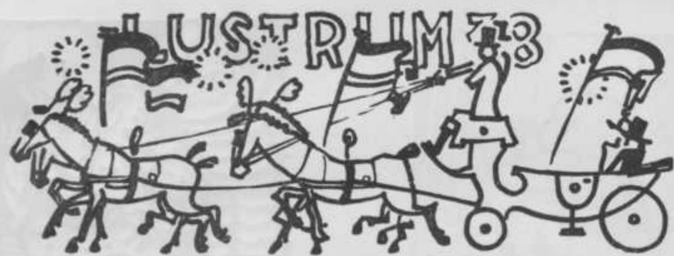
EEN FICTIE GEINTERVIEWD.

UITGAVE EN ADMINISTRATIE: NAAMLOOZE VENNOOTSCHAP W. D. MEINEMA - HIPPOLYTUSBUURT 6 14e JAARGANG VRIJDAG 21 JANUARI 1938 8 BLZ. No. 16