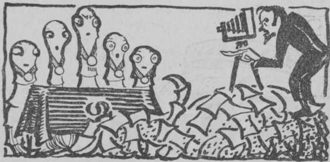
Prima Senaten te kust en te keur.

In het verkiezingsbulletin van „De Spiegel” heeft U de slogan kunnen lezen: Het Corps is dood, stemt rood. Het Corps is dood, denkt U, en dus zal de komende Senaat „slecht” zijn. Niets is minder waar. Neemt U de laatste Almanak ter hand en bladert U eens in de naamlijst. U zult verwonderd zijn over de vele homogene Senaten, die U daaruit zult kunnen putten.