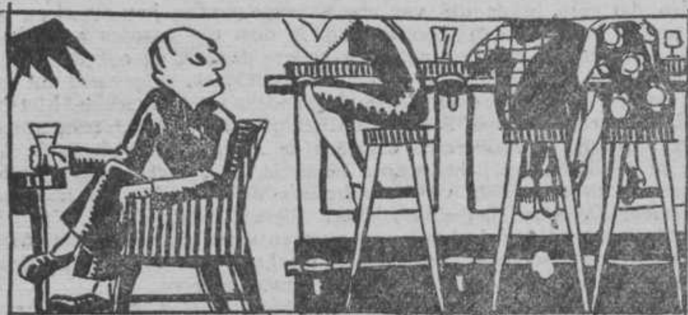
Baarman in de Spiegelbar.