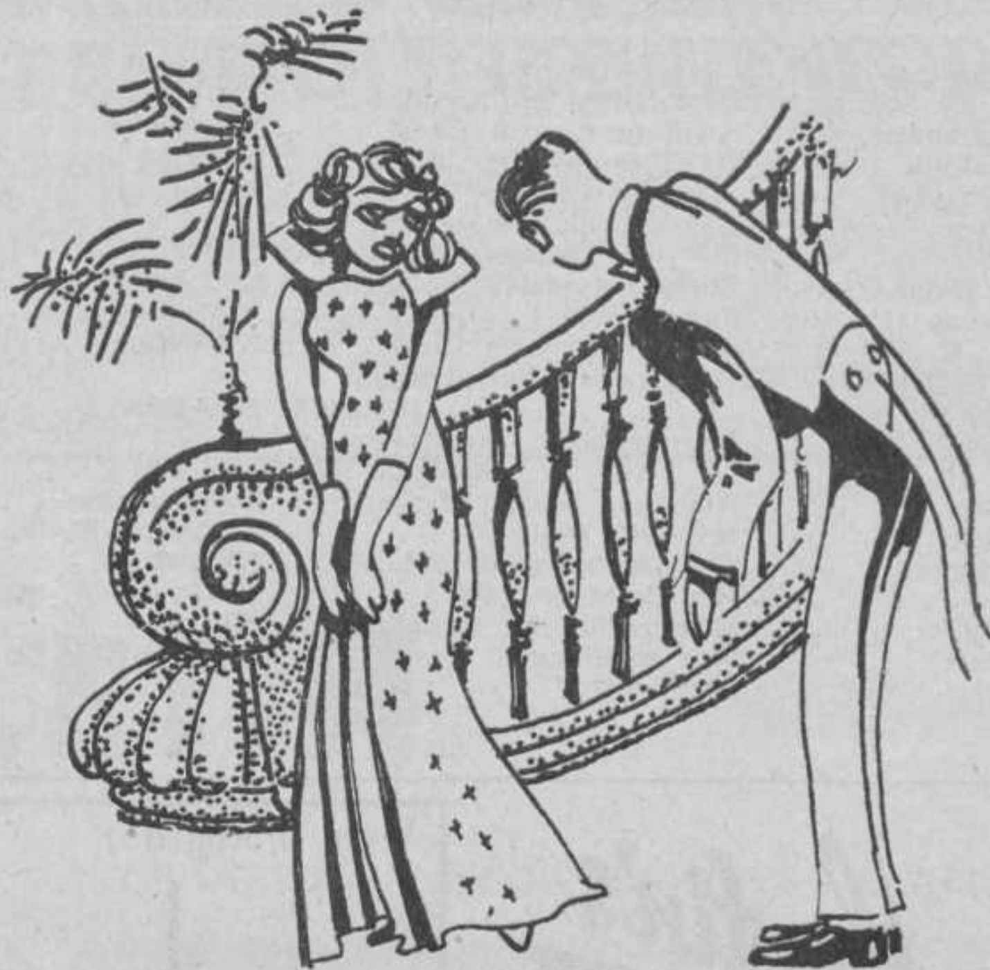
... aller ridiculist costume ...

„Gij meent het niet”, zei ik om maar iets te zeggen. „Jonker Govert”, fluisterde ze, „Ik wist wel dat gij weer het origineelste plan zoudt bedenken, maar dat het zo dwaas zou zijn, dat men het over honderd jaar vast nog niet draagt, dat had ik niet kunnen gissen”. „Ik... ik bewonder u een beetje”, zei ze en legde haar blonde hoofdje op de goed gevulde schouder van mijn dubbele brested.