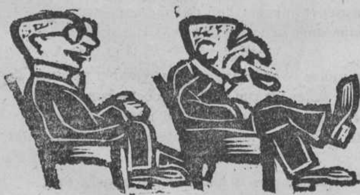
... moeilijke weg ...

Speciaal geldt dit de Commissie van Bijstand in wie de Senaat een grote steun heeft gevonden en die krachtens de wijze waarop zij zich van haar taak heeft gekwetend alle lof van het Corps verdient.