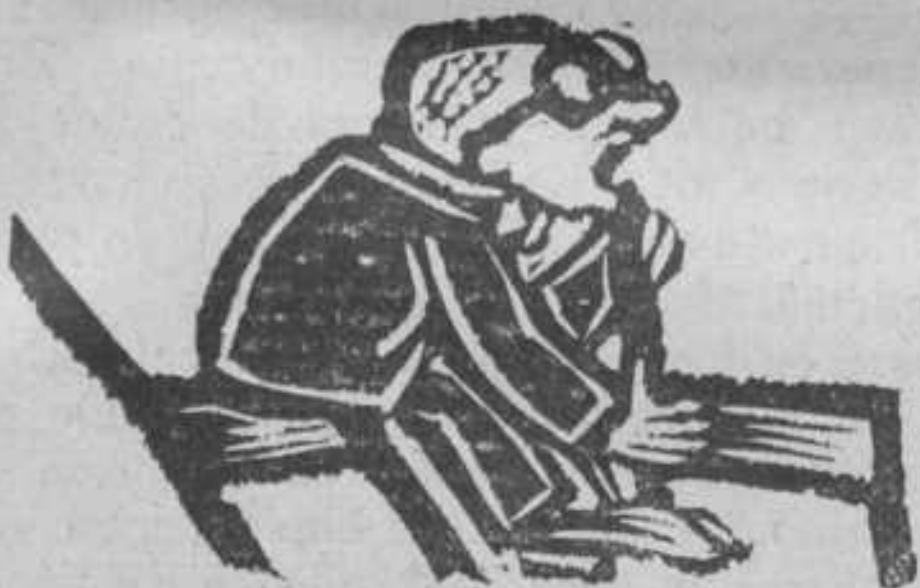
... staat thans allen op ...

En juicht of jammert vooral niet ondoordacht mee met een groep die het luidruchtigst en schijnbaar het belangrijkste is.