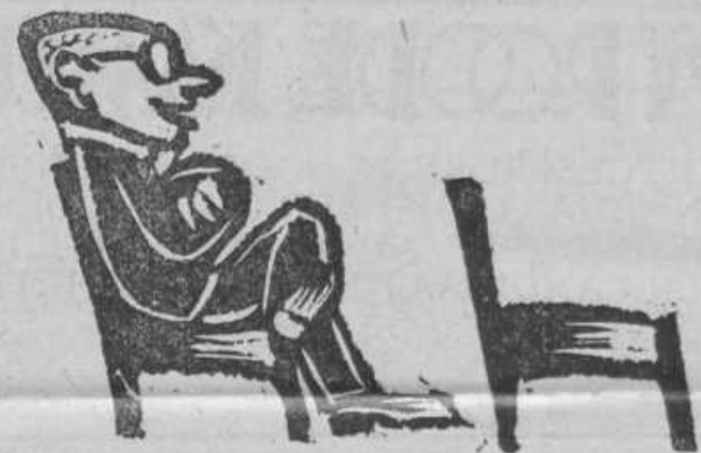
... het einde nabij ...

Waarschuwen wil ik U opdat Gij het voorrecht niet zult onderschatten en de gevaren eraan verbonden niet over het hoofd zult zien.