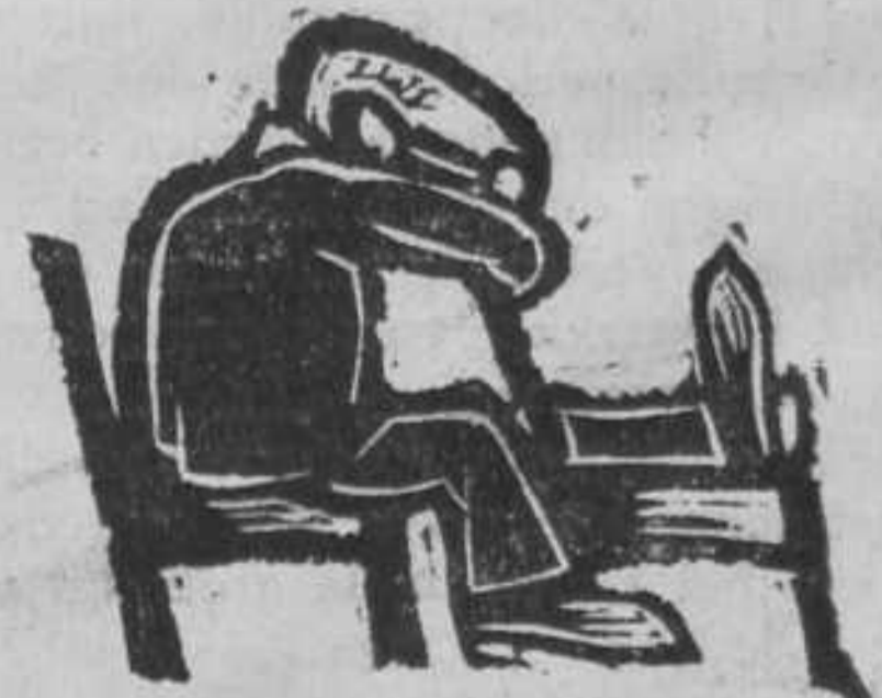
... met welk een spanning ...

Zonder de ernst dezer besliste gebreken te verdoezelen, is dit begrijpelijk. Want tot voor kort, is alles voor U gereed gemaakt en alles voor U gedaan. Uw leven is ingepast geweest in een geraamte dat door anderen is gebouwd en onderhouden, en dat werd aangepast aan Uw ontwikkeling en de