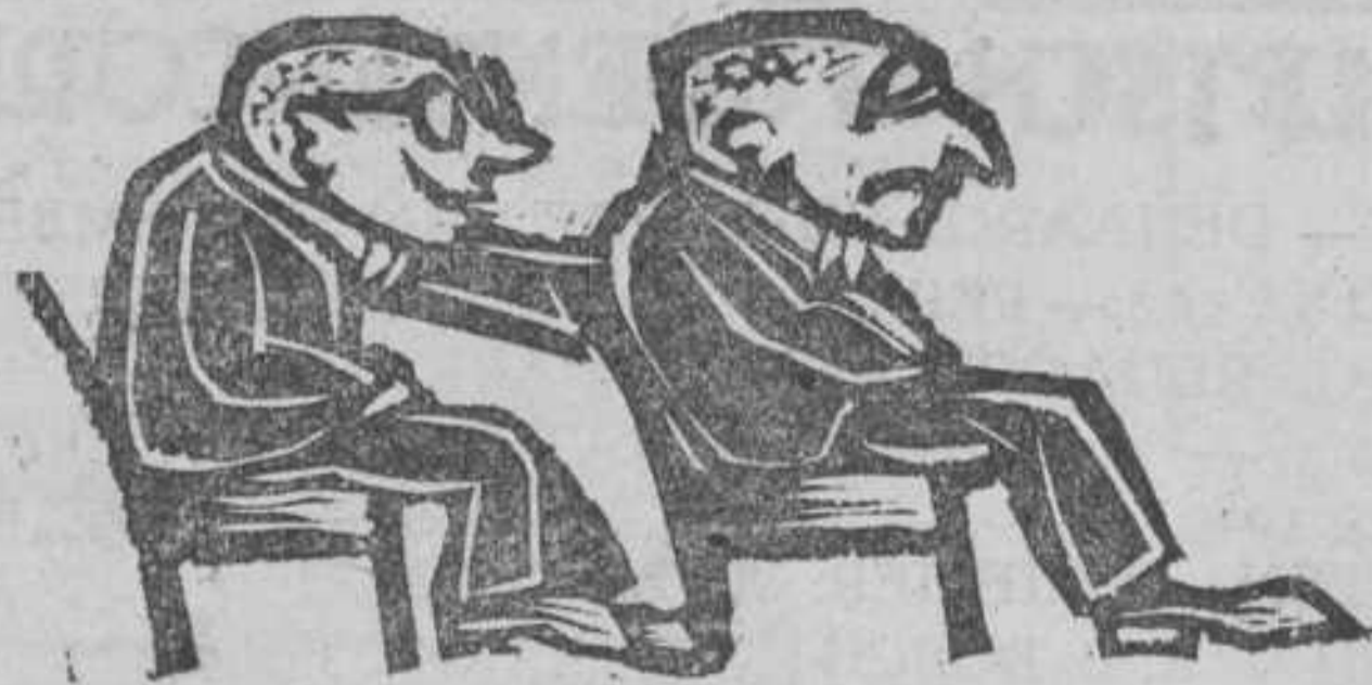
... schuilen gevaren ...

De groentijd is geweest als steeds, een toetssteen voor het nulde jaar, maar haast nog méér een proeve voor het Corps en elk zijner leden afzonderlijk.